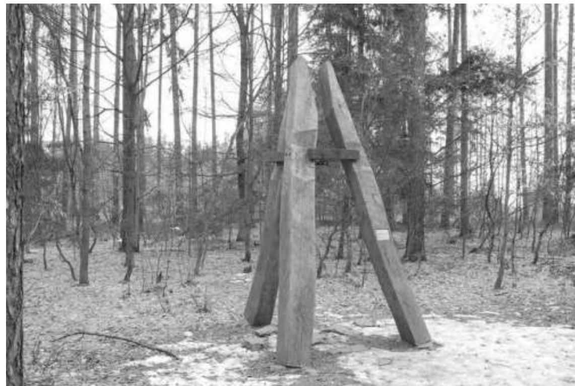
Svazek obcí Ponávka