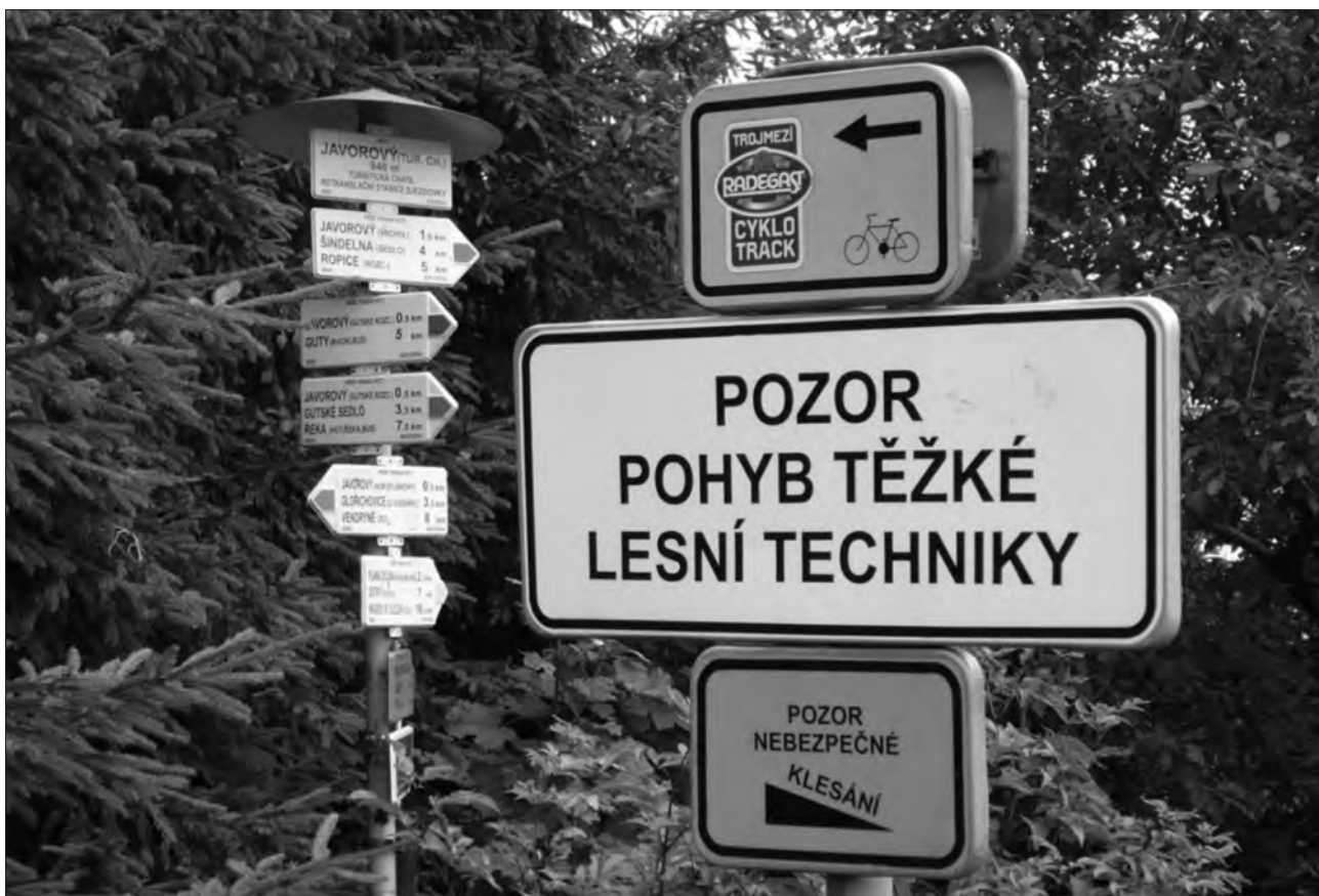
Obr. 2: Sřet zájmů na lesní cestě.