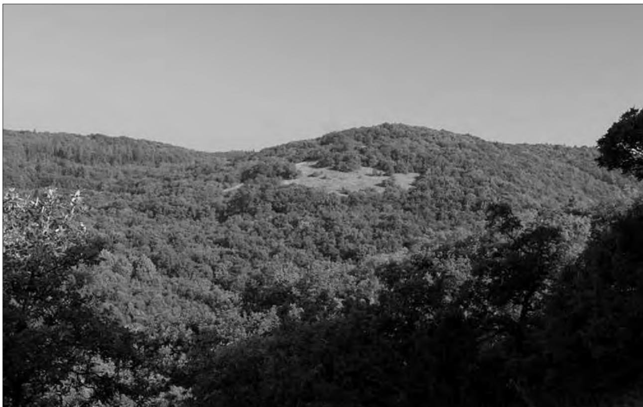
Vrch Doutnáč, území ponechané samovolnému vývoji.

Lesy zauímají svou výměrou 4 927 ha 38% plochy CHKO. Ve vlastnictví státu je 63% lesů CHKO (59% s právem hospodaření LČR, 4% AOPK). Zbýlých 27% je v majetku 2 velkých soukromých vlastníků a mnoha drobných, včetně obcí. Z vlastnické struktury vyplývá nutnost spolupráce Správy CHKO s LČR jako subjektem hospodařícím na největší výměře lesů Českého krasu.